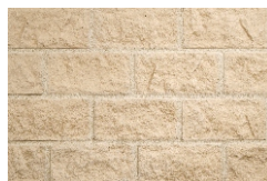
F04 M (Piesková)