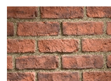
F30 Mix (Hnedo-červená)

* všetky farby je možné vyrobiť aj v čistom prevedení (bez mixu)