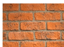
F05 Mix (Oranžová)