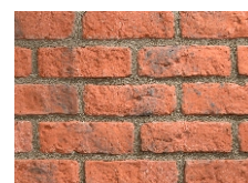
Rustik Mix (Tehlová)