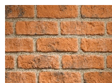
F01 Mix (Hnedá)