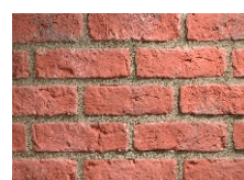
F13 Mix (Vínová)